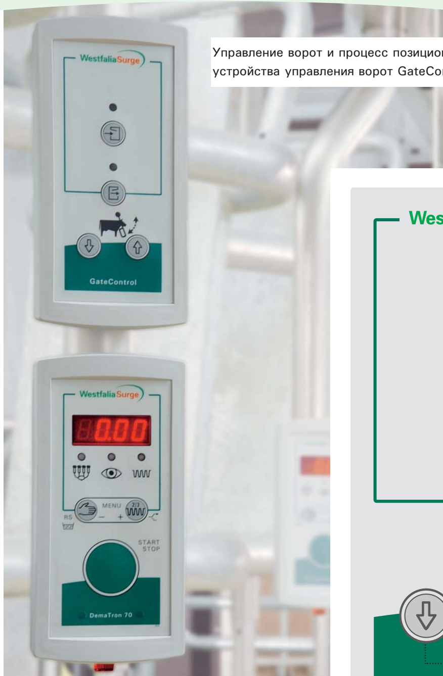
Управление ворот и процесс позиционирования с помощью устройства управления ворот GateControl в доильном зале